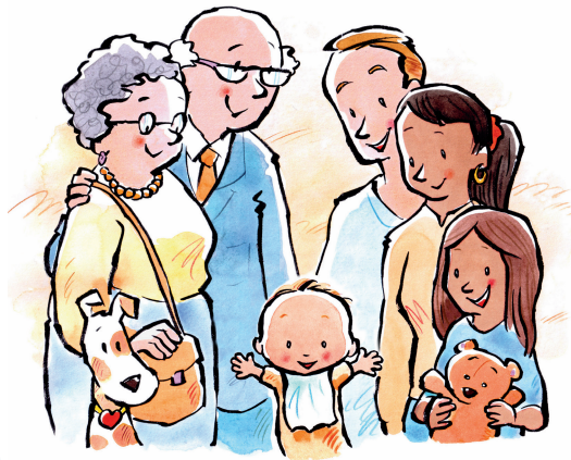
ብኣተሓሳስባኡ ኣያል ንክኸውን ምእንቲ ኩሉኹም ከትተሓጋዝ ይግባእ!

ብኣተሓሳስባ ኣያል ከበሃል ከሎ ድማ እቶም ደቀይ ሙሉእ ናይ ኣእምሮ ጥዕና ኣለዎም ማለት እይ። እቶም ደቀይ ሙሉእ ናይ ኣእምሮን ኣካልን ጥዕና ምስዝህልዎም፣ ብዘይጸገም ከምዕብሉ ይኽእሉ። ደቀይ ኣድሻ ነገር ይመሃሩ። ኣደሓደ እዋን ድማ ዘሽግርዎም ኩነታት ኣለው። ደቀይ ብኣተሓሳስብኡም ኣያላት እንተኾይኖም፣ ዝኾነ ዘጋጥምም ጸገማት ከይተሸገሩ ክፈትሖዎ ይኽእሉ።